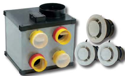
Version kit SILENCIO HV